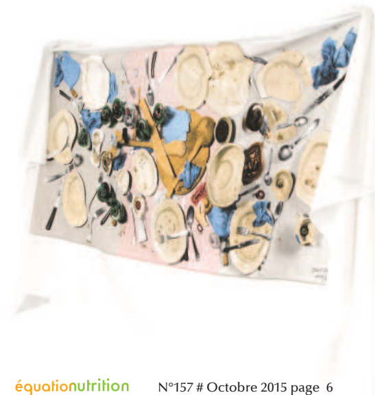
Exposition La 4000e Spécimen Galerie Fréchet Attitude

En conclusion, de nombreuses mesures sont déjà mises en place pour réduire le gaspillage alimentaire, compte tenu de l'attention accordée aux fruits et légumes, à tous les stades de la filière. Si le gaspillage comporte aussi une forte dimension morale et personnelle, les marges de manœuvre passent par une meilleure valeur attribuée aux produits comme aux métiers de la filière. Car ce qui a de la valeur ne se gaspille pas...ou moins !